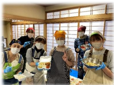
みんな、笑顔で待ってるよ！