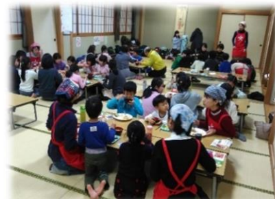
みんなで食べるとおいしいね♪