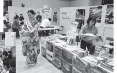
各地域がブースを出典