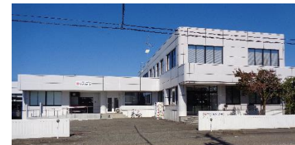
部会で視察させていただいた「スリージョブながおか」さん