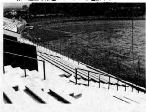
▼緑の芝生と紺色のフェンスが色鮮やか

新長岡発展計画 生活環境 来春、新装オープンノ 悠久山野球場は 老朽化のため昨年からの改修中の悠久山野球場は、工事もほぼ終わり、今は内装にとりかかっています。 今回の改修では、①内野スタンドを屋内練習場を備えたものにつくりかえ②グラウンドの排水性を良くする③フェンスに紺色のラバーを張り④内野スタンドの座席をプラスチック製のものにした。 新しくなった悠久山野球場のオープンは来年の暮らちなみに、来年は甲子園の予選のメイン会場になる見込みです。