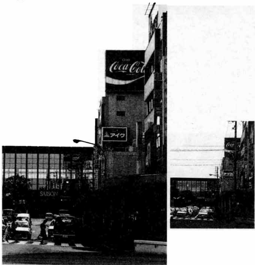
▲電線、電柱がなくなり、スッキリした大手通り。 右の写真は施工前に撮影したもの。

街並みスッキリ！ 大手通りから電線が姿を消しました。 続いて南中央通り(大手通り)追廻橋 で工事が進んでいます。