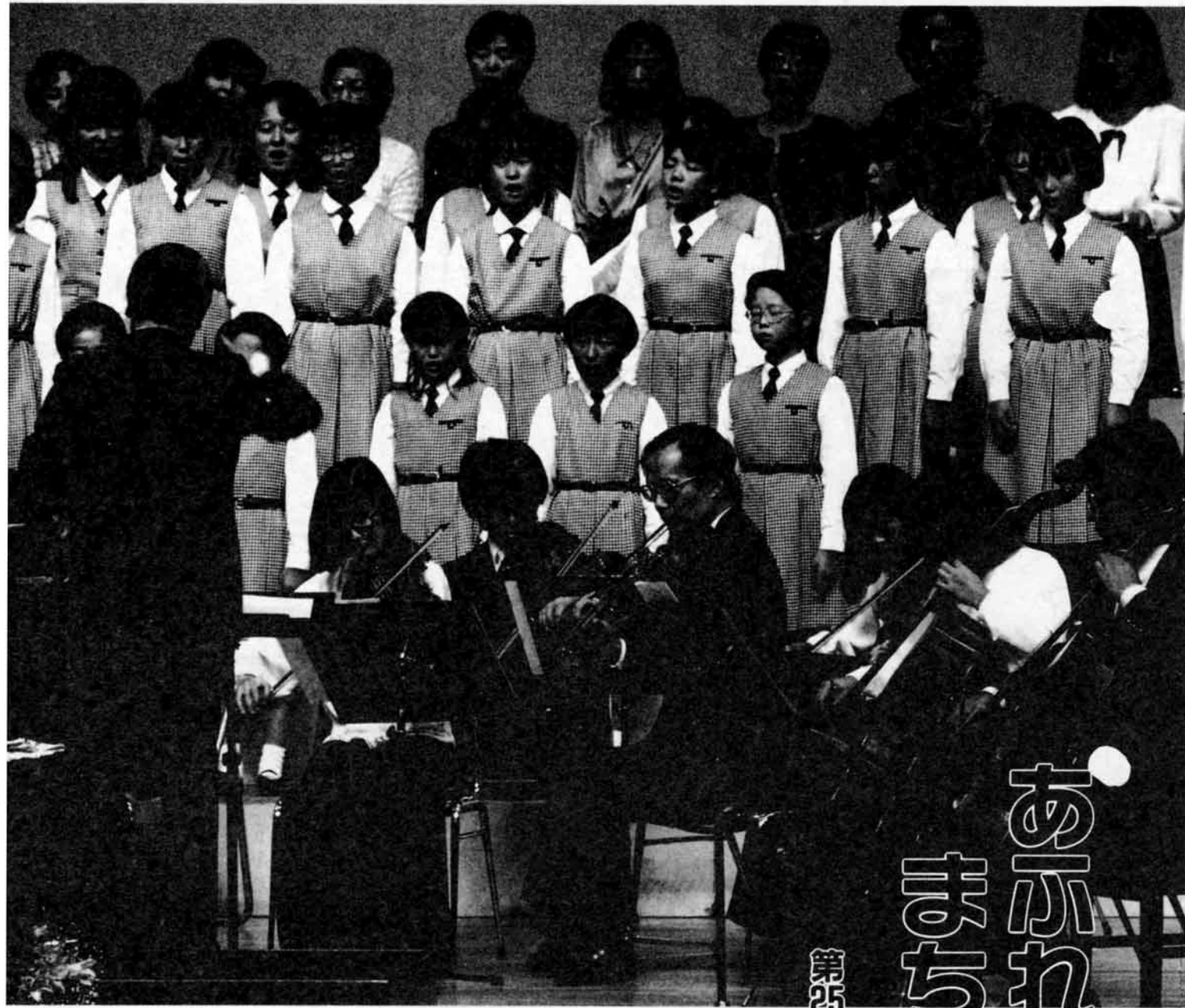
第25回長岡市民音楽祭