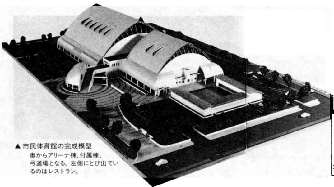
▲市民体育館の完成模型 奥からアリーナ棟、付属棟、弓道場となる。左側にとび出ているのはレストラン。

えていま 観客席は、二階に千八席の固定席のほか、フロアに二千席以上の移動席も設けることができ、全日本クラスのスポーツ観戦もバッチリ楽しめます。 付属棟は、地下一階に多目的ホール、一階にトレーニング室や会議室、そして二階には柔道場と剣道場を備えています。 また、体育館の西側に別棟として弓道・アーチェリー場を設置するほか、体育館の利用者に限らずだれも