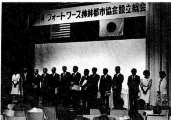
▲姉妹都市協会の設立総会（9月24日現在、会員数は個人・法人合わせて617人）

フォートワース市との国際姉妹都市の締結調印を控え、長岡・フォートワース姉妹都市協会の設立総会が九月十七日、ホテルニューオータニ長岡で開催されました。 総会には会員約二百五十人が出席し、協会の規約、役員、事業計画、収支予算を審議。事業計画では、十