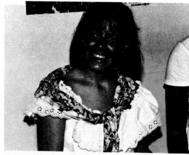
▼9月13日、技大祭のラテンアメリカコーナーで

●違反建築防止週間 10月11日～17日 10月15日に、全国一斉の公開建築パトロールを行います。また、期間中に建物の安全性、環境問題など、建築基準法の疑問点について相談を受けたいです。お気軽にどうぞ。 担当 建築住宅課審査係(市役所3階) ☎内線三三三