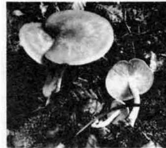
クサウニベニタケ(毒きのこ)

形も匂いも色も温和なので誤食され中毒が多い。主に雑木林の中に群生あるいは点在し、茎が細長く指でつまむとフカフカ柔らかい。胞子はピンク色。食毒きのこ鑑別には多くの俗説があるが、そのような貴重な見分け方はないのでご注意。