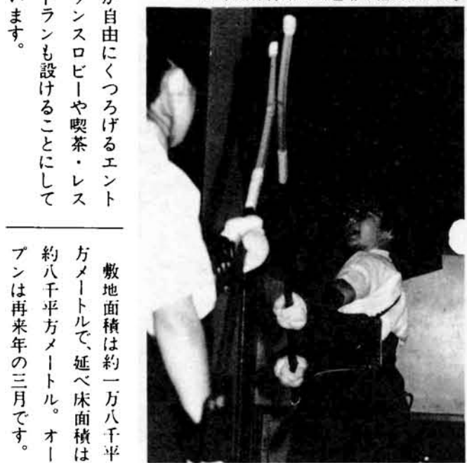
▼市民体育館は武道場も備えている。

が自由にくつろげるエンターテインメント施設も備えています。 敷地面積は約一万八千方メートルで、延べ床面積は約八千方メートル。オープンは再来年の三月です。