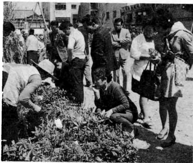
写真は、厚生会館東側で開かれた苗木と花の即売会風景、安い苗木に、みんな大よろこび。

市民の皆さんにすっきり定着した「苗木と花の即売会」は、ことしも春と秋に計画し、すでに春の即売会は、四月の十四日、十五日にひらかれ、なかなかの盛況でした。