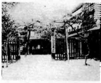
旧表町小学校と、旧町会議所

・明治公園 もし、まちなん中は騒々しいものだ、という固定観念のある人は、ここを訪ねられたら、その考えを改めなければならぬでしょう。市立互尊文庫を包むように、静かなたたずまいを見せるこの明治公園は、昭和十四年の開園で広さは〇・六ヘクタール(千八百坪)