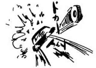
あの世行き 酒が運転する車

死亡が三倍に ことし長岡市内で発生した交通事故は、四月十八日現在、事故件数二百三十九件、負傷者三百四人、