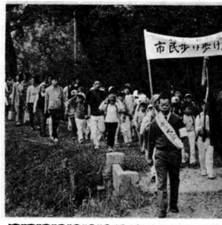
婦人スポーツ教室、地域スポーツ教室なども開き、多数のみなさんから参加していただきました。 市では、ことしからレクリエーション課を新設いたしました。これからは、市民スポーツ広場の建設や学校開放などスポーツの場を広げていくとともに、子どもからおとしよりまで、市民みんなが加えられるスポーツ行事を盛りたくさん計画してまいります。どうぞお気軽にご参加ください。

昭和四十年から総務府が中心になって、全国に呼びかけをしてきたものです。 長岡市は、この体力づくり運動の提唱が始まるの先がけて、市民体力づくり運動に積極的に取り組む「成長期の青少年には健康な体とたくましい心を、成人やおとど若さと健康を」を目標に、たくさんの方を導いてまいりました。 県民スポーツの日や体育の日には、「市民登山」や「歩け歩け大会」(写真)、「母子体力づくり大会」(写真)、「母子体力づくり大会」など、いろいろな行事を行なってきました。 また、厚生会館や、市内の学校を利用して