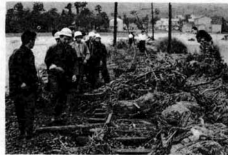
36・8集中豪雨による栖吉川水防団 法費で出動した栖吉川水防団

ながいあいだ市民の生命と財産を守り続けてきた栖吉川水防団が、さる十月二十五日、厚生会館で解団式を行ないました。 栖吉川水防団は、昭和二十四年結団して以来二十三年余り、幾多