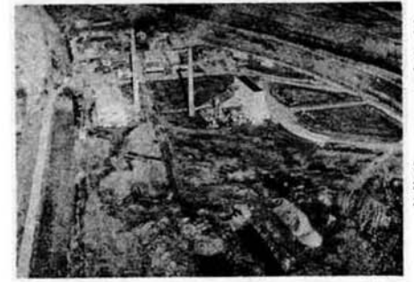
（写真）下水処理場建設予定地。上部の煙突はゴミ焼却場。

昭和四十四年九月、「農業振興地域の整備に関する法律」が施行され、これからの農業をより魅力のあるものにしていくための、いろいろな施策が講じられることになりました。 この法律の特徴は、農業振興地域を指定して、ここに重点的な農業投資をしていこう、というところにある。逆にいえば振興地域を指定できないと、国の補助などを受けることが困難になります。 そこで市としては、振興地域の指定を受けるべく、現在県との間に協議を進めています。なんとといっても将来の農業の進路を決定する、すこぶる重要な問題です。市民のみならず、関心をもつていただくよう、以下簡単にその概要をお知らせしてみたいと思います。