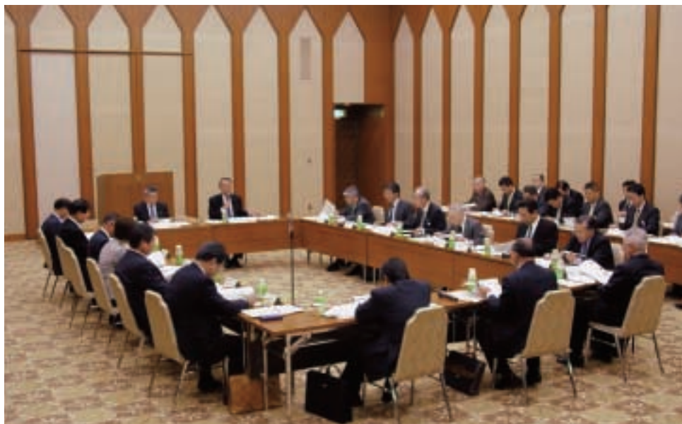
小委員会のようす