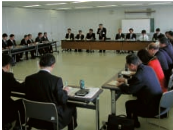
前橋広域市町村任意合併協議会視察の様子

視察は前橋広域側8人の事務局員から対応していただき、事務局次長から1時間30分ほど説明を受け、その後、質疑を行いました。