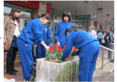
▲サルビアを植える参加者

市民のみなさんが花づくりを学びながら、秋まで大切に手入れしていきます。駅前を通る際にぜひご覧ください。