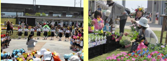
▲オープニングでは震災復興支援ソング「花は咲く」を大合唱

長岡市花いっぱいフェアが5月25、26日に市民防災公園で行われました。花とタネの名前当てクイズ、おし花体験、花ポットづくりなど約40のコーナーを市民団体が企画。2日間で約3万9千人が花と緑に親しみました。