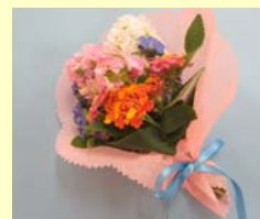
▲ブーケに使用する花のイメージです