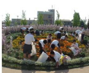
▲緑花センターの花壇の手入れをする生徒たち

平成15年から市民プランター植栽ボランティアに継続して参加し、地域へ感謝を込めて活動してきました。また、部活動やクラス単位のほか、生徒同士が声を掛け合いながら緑花センターの花づくり活動にも取り組んでいます。