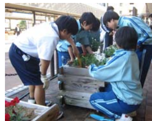
▲長岡駅前市民プランターづくりに参加