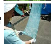
アイの葉(上) 染めの実習(下)