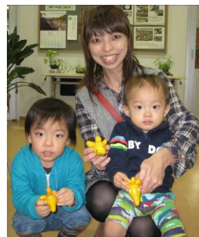
▲親子で楽しめます！