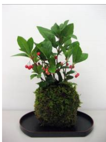
▲コケ玉のイメージ。 材料は異なります

期 日：1月19日(土) 時 間：午前10時～11時30分 講 師：NPO法人 花いっぱい推進協議会 材料費：1,500円 定 員：20人(先着) 申込み：12月10日(月) ～1月11日(金)