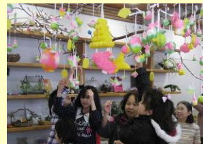
▲昨年のまゆ玉飾り

時 間：午後1時30分 ～45分程度 材料費：500円 定 員：20人(先着) 申込み：12月10日(月) ～24日(月)