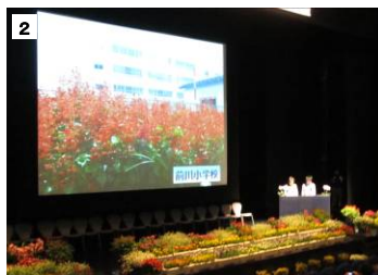
【2】最優秀賞団体が花いっぱい活動を発表しました。