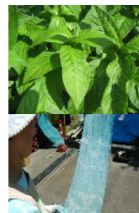
アイの葉（上）と、 染めの実習（下）