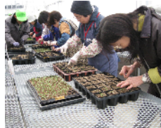
繊細な根を崩さないように、みなさん丁寧にそっと作業をしていました。