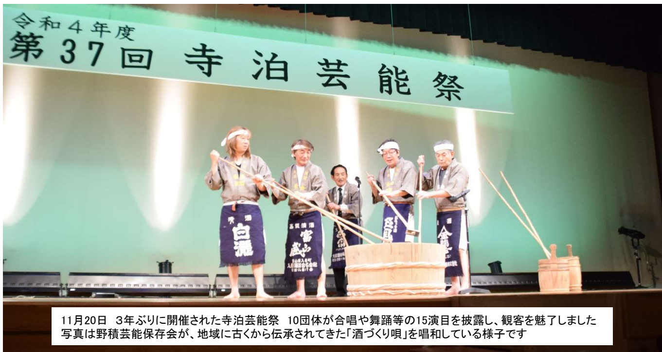
11月20日 3年ぶりに開催された寺泊芸能祭 10団体が合唱や舞踊等の15演目を披露し、観客を魅了しました 写真は野積芸能保存会が、地域に古くから伝承されてきた「酒づくり唄」を唱和している様子です

■発行／編集■ 長岡市寺泊支所地域振興・市民生活課 地域振興・防災担当 ☎0258-75-3111 FAX 0258-75-2238 E-mail tr-chiiki@city.nagaoka.lg.jp