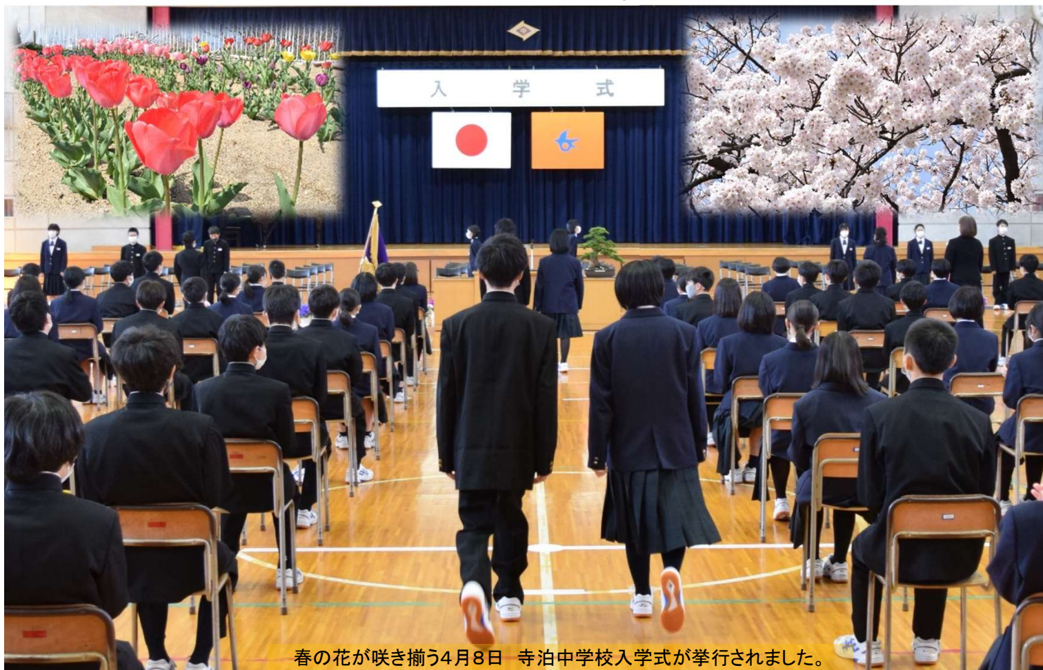
春の花が咲き揃う4月8日 寺泊中学校入学式が挙行されました。

■発行／編集■ 長岡市寺泊支所地域振興・市民生活課 ☎0258-75-3111 FAX 0258-75-2238 E-mail tr-chiiki@city.nagaoka.lg.jp