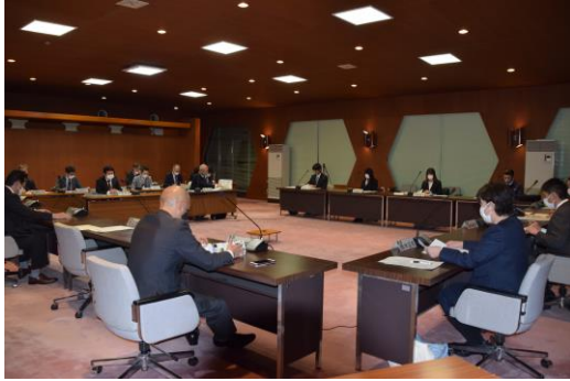
地域委員会の様子(令和5年2月22日)

今後中之島地域のまちづくりは、コミュニティ推進組織と行政が話し合いを重ねながら、力を合わせ、誰もが住みやすい地域になるよう地域課題の解決に向けて取り組んでいきます。