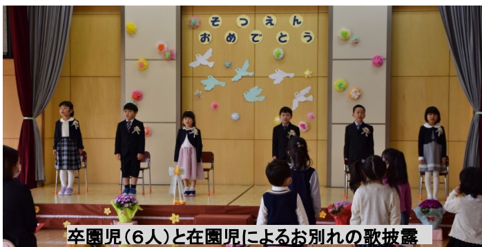
卒園児（6人）と在園児によるお別れの歌披露

昭和33年明源寺本堂にて開所してから63年間、地域の皆様と共に歩んできた中条保育園が、3月31日をもって閉園となりました。（3月27日）