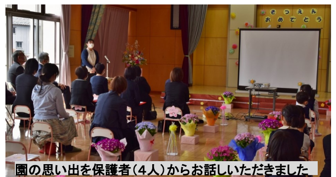
園の思い出を保護者（4人）からお話しいただきました