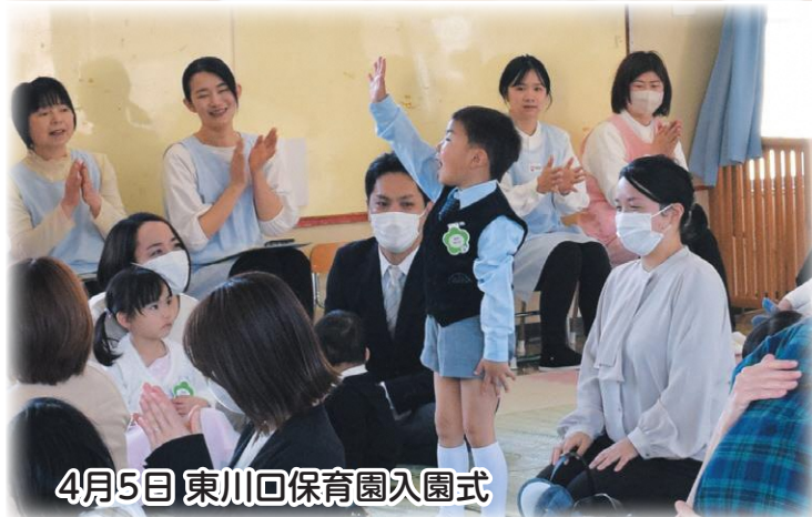
4月5日 東川回保育園入園式