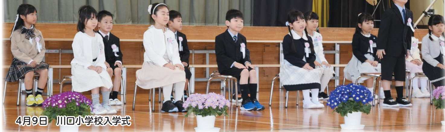
4月9日 川回小学校入学式