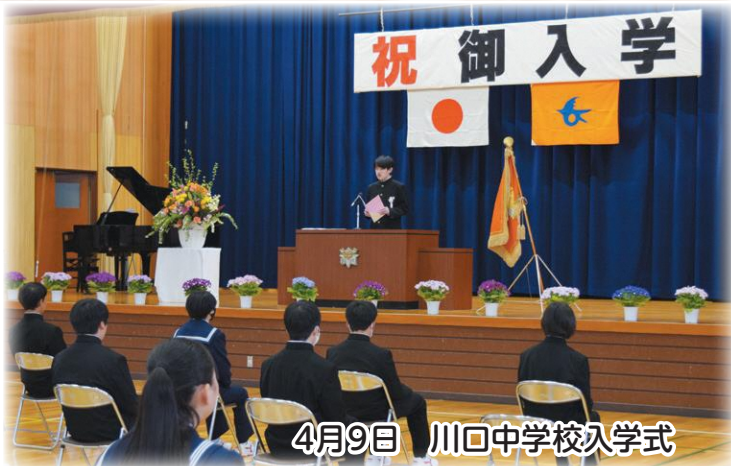
4月9日 川回中学校入学式