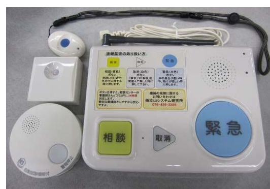
実際の緊急通報装置