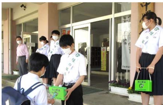
◇川口中学校生徒による募金活動の様子◇