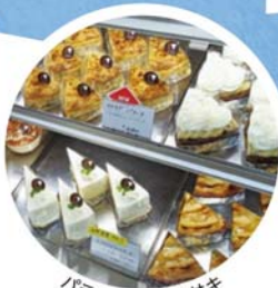
パティスリーカワサキ