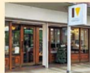
パティスリーカワサキ