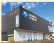
オオミヤスポーツ