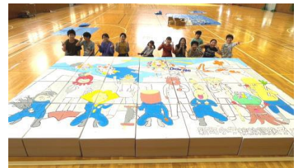
▲昨年の制作の様子