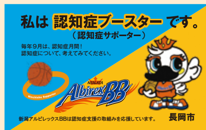
認知症ブースターカード