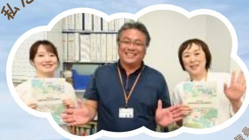
相談センター職員