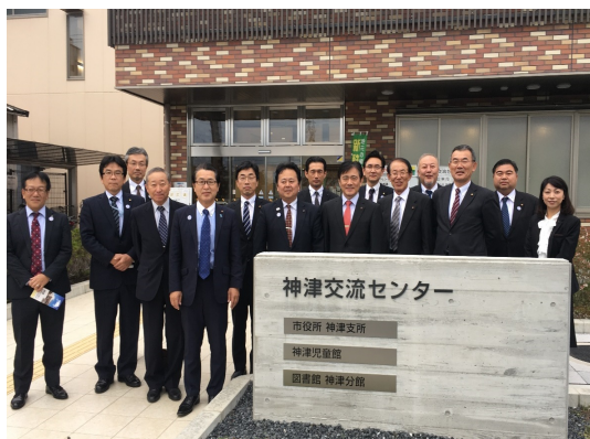
伊丹市神津交流センター

伊丹市では、平成27年度に公共施設再配置基本計画を策定後、兵庫県内で初めて「公共施設マネジメント基本条例」を制定しました。総合政策部政策室が部局を超えて検討を行い、公共施設再配置基本計画を準備する中で、総合管理計画の継続性を担保するためには