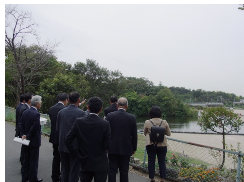
東海市加木屋地域・山之脇池（ため池）

そこで、大田川流域の計画的な治水対策を推進するため、平成27年度に「東海市100mm/h安心プラン」を県、市町村、河川管理者、住民や民間企業などが主体となり策定しました。そして、平成28年2月には国土交通省からこの認定を受けたことにより、社会資本整備総合交付金や流域貯留浸透事業の交付要件緩和による支援が可能となり、浸水対策が計画的に進められているとのことでした。この東海市の取り組みを参考として、本市での浸水被害の軽減に努めていきたいと感じました。