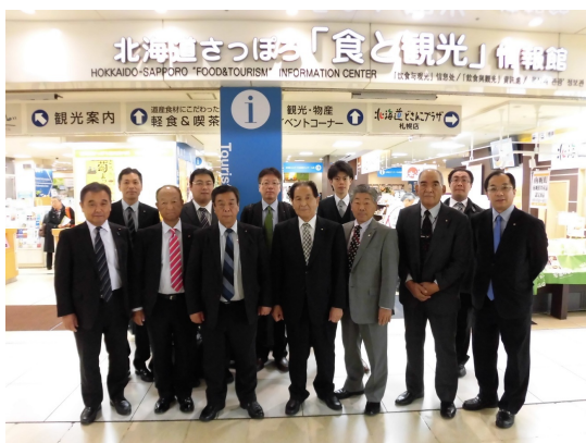
北海道さっぽろ「食と観光」情報館・キタベル

札幌市では、「北海道さっぽろ『食と観光』情報館・キタベル」について視察しました。本施設は、道内の観光案内と食の魅力の発信拠点として、北海道、札幌市及びJR北海道の3者により平成19年に整備された施設です。施設では、道内全域の観光情報を発信し、物産も行っているほか、増加する外国人観光客への対応に注力しています。施設は観光案内所の機能を有しており、案内所の職員は英語、中国語又は韓国語のいずれかを話すことができます。案内所の外国人利用者数は年々増加しており、平成28年度の外国人利用者数が過去最高の8万6千人となるなど、本施設は道内のインバウンド観光の玄関口として機能していると感じました。