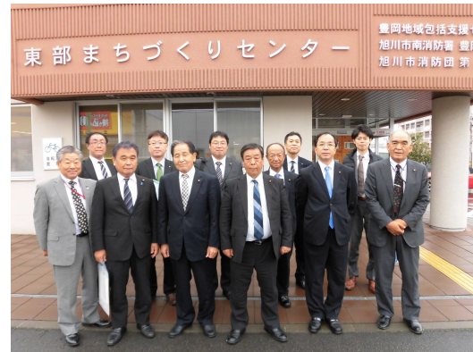
旭川市東部まちづくりセンター

このような機能の複合化による利便性に加え、周辺に保育所や商業施設が集積し、人が集まりやすいという立地も相まって、本施設の地域住民の拠点としての可能性を感じました。本市においても、今後の地域コミュニティの拠点のあり方や、複数の施設の一体的整備による整備費の抑制手法等の観点から、今回の視察は大変参考になるものでした。