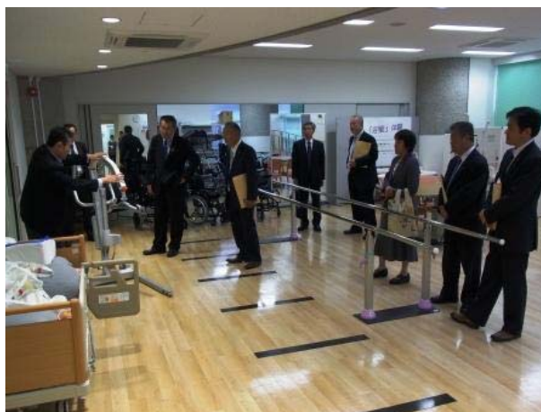
仙台市障害者総合支援センター

この施設の大きな特徴です。主な業務内容は、高次脳機能障害者支援、中途視覚障害者支援、重度障害者コミュニケーション支援、障害者の健康づくり、テクノエイド推進などであり、併設する健康増進センターや発達相談支援センター、保健、医療、教育、就労等の関係機関と連携して人材の育成や事業を行っている仙台市の取り組みは、学ぶことが大いにあり、特に最近増加傾向にある高次脳機能障害や指定範囲が拡大される難病の支援などの取り組みは大変参考になりました。