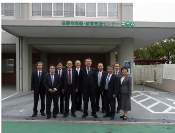
日野市発達・教育支援センター

日野市では、「発達・教育支援センター（エール）」を視察しました。この施設では、0歳から18歳までの子どもの育ちを切れ目なく支援しています。福祉と教育（教育委員会・小学校・中学校）が一体となって、日野市在住の本人や子どもの育ちや発達に不安を持つ家族とその関係者を対象に相談支援・発達支援・教育支援・療育支援を行っています。地域との連携も進めながら「気づく・育てる・見