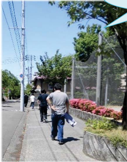
青空の下ウォーキング