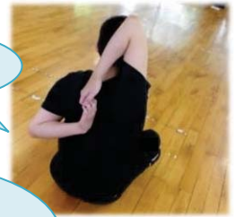
風船を使ったトレーニング