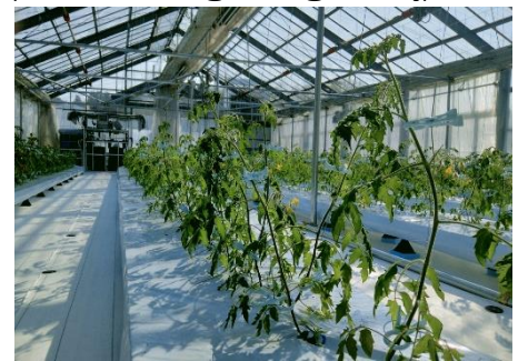
次世代型の栽培温室では 高産量トマトを栽培中(販売予定)