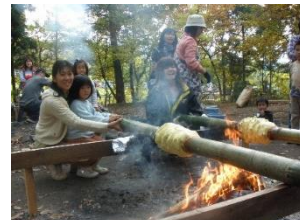
美味しく焼けるかな?