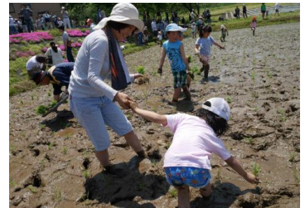
どろんこになって楽しもう！

【申込み期日】5月24日(火)～27日(金) ※定員50組に達した時点で受付終了。