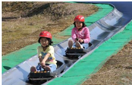
1回滑ったら、もうやめられない！

【料金】 ・大人1回300円 ・小学生1回200円 ・4歳以上の未就学児は無料 ※未就学児に同乗する保護者は有料 【問合せ】TEL0258-34-2225