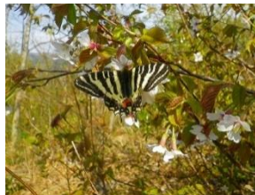
春の使者 ギフチョウ