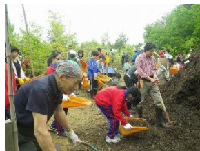
がんばってパークチップ