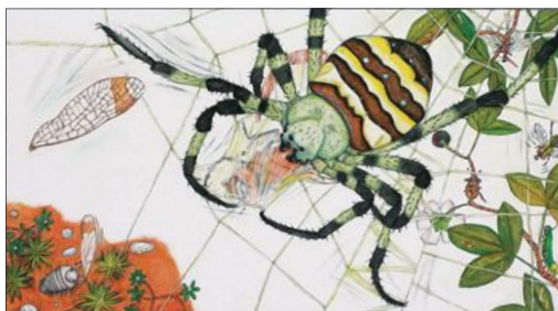
『だんごむしそらをとぶ』小学館