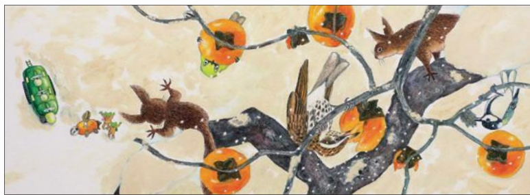
『あまがえるりょうこうしゃ ゆきやまたんけん』福音館書店

今年、画業56年を迎えた松岡さん。その多彩な画業を振り返るとともに、自然を愛し自然に育まれてきた松岡さんの、豊かな作品世界を紹介します。