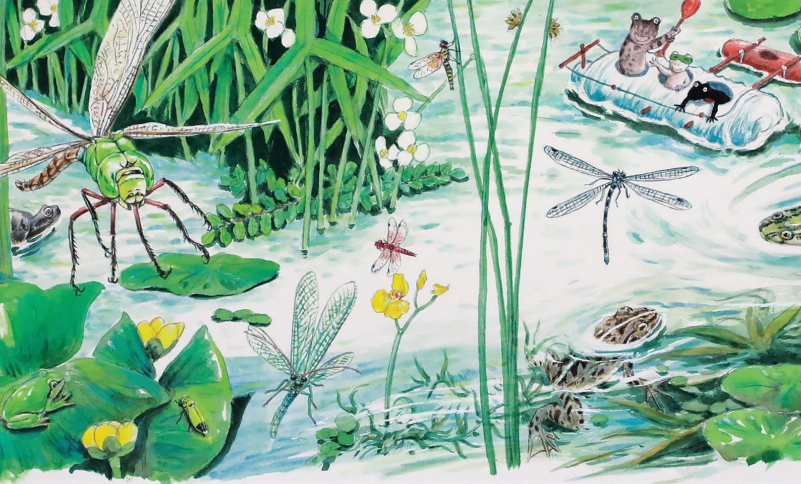
「イモリくんやモリくん」(部分) 岩崎書店