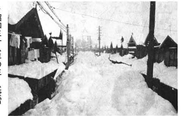
昭和三十八年の三・八豪雪