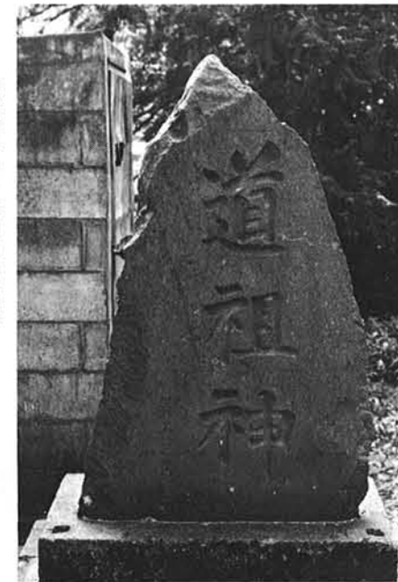
八幡様にある道祖神の石碑