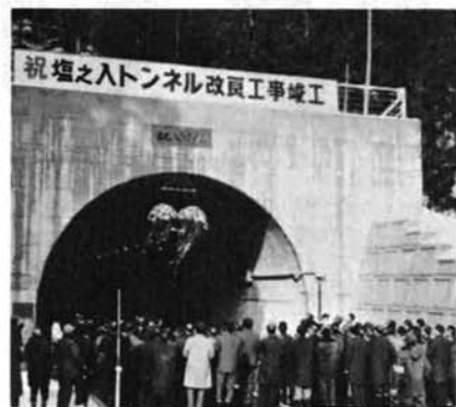
▲全面改修され明るくなりました

3年がかりで工事を進めていた与板町と和島村を結ぶ、県道与板一北野線の塩ノ入トンネルの改修工事が完成し、12月16日、関係者が集まり開通を祝いました。