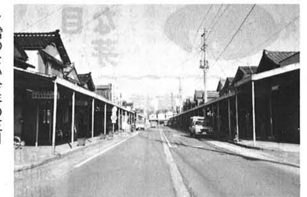
雪のない今年の正月