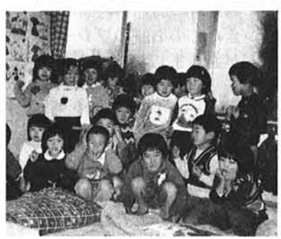
黒川保育所の園児達

昭和五十七年度の与板保育園、黒川保育所、本与板保育所、与板幼稚園の入所申請を次の要領にて受付いたします。 ★保育園の入園申請 一、入所の資格 昭和五十二年四月二日以降に生れた幼児で与板町に住所を有し、かつ家庭に於いて保育に欠ける状態にある児童であること。 二、保育所の定員 与板保育園 一〇〇名 黒川保育所 六〇名 本与板保育所 六〇名 三、申請受付年月日並びに場所 ①一月二十二日(金) ②午前九時～午後三時三十分まで ③与板町役場男子厚生室(二階) 四、申請用紙は役場受付黒川保育所、本与板保育所、与板保育園に用意してあります。 事前に必要な事項記入の上当日係に提出して下さい。 ★幼稚園の入園申請 一、資格 昭和五十一年四月二日から昭和五十二年四月一日までに生まれ、与板町に住所のある幼児。 二、定員 一六〇名 三、申請書の提出 入園を希望される方は、昭和五十七年一月十九日までに、教育委員会(町民体育館)又は与板幼稚園へ申請書を出して下さい。 四、申請用紙は用紙は該当児童世帯へ配布いたしました。必要事項記入の上、提出して下さい。 尚、配布もれの方は、お手数でも教育委員会へお申し出下さい。 ※ C1よりD9までの各階層の徴収基準額欄の( )の数値はその属する世帯から2人以上の児童が入所している場合はその2人目以降の児童に対して徴収される金額です。但し、C1～D4階層に属する世帯については最も徴収基準額が低い児童以外の児童D5～D9階層に属する世帯については、最も徴収基準額が高い児童以外の児童に適用する。 ※ C1階層よりD1階層に位置する世帯に、前年度分の固定資産税が4千円から1万円以上賦課された場合には、1階層上位の階層が適用されます。