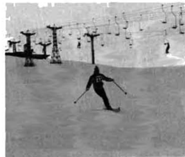
▲ゲレンデで一生懸命に練習

たそうです。でもシーズンの短いスポーツなので、活動期間が短く、たいした行事もやっていないのでねと謙遜の声ですが、やっと我らのシーズンが来たという感じ。「冬はコタツにばかり入っていないで、思っきりゲレンデに出て、皆さんで楽しく滑りましょう」と入会を呼びかけるスキークラブの皆さんです。