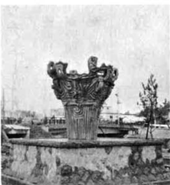
▲河川公園に設置された聖火台

新潟国体の年に、与板町体育協会が作成し、町に寄附した聖火台が、役場脇の駐車場から別院橋のすぐ脇の河川公園広場に移されました。