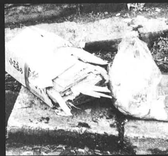
■忘れられた燃えるゴミ