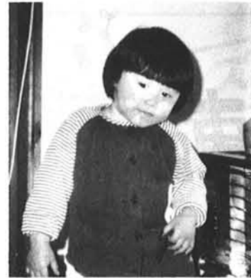
わが家のアイドル

皆さん！ 私はチビちゃんです。体はチビでも元気なのは人一倍なんです。大人ときたら自分達が気に入らないとすぐに「これダメ、あれダメ」と言って怒ります。ちっとも子供の気持ちなんか考えてくれないのよ！子供にすれば無心になって遊んでいるというのに！なんて身勝ってな大人なんでしょうか？でも私は思っています。絶対に負けないぞ！と！こんな小さな体と手で、この家の人達の心に光と愛を灯し続けているんです。今日もイタズラで笑いをふりまいてるチビちゃんなんです。