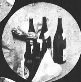
■ビールビンや酒ビンは酒屋さんへ出して下さい