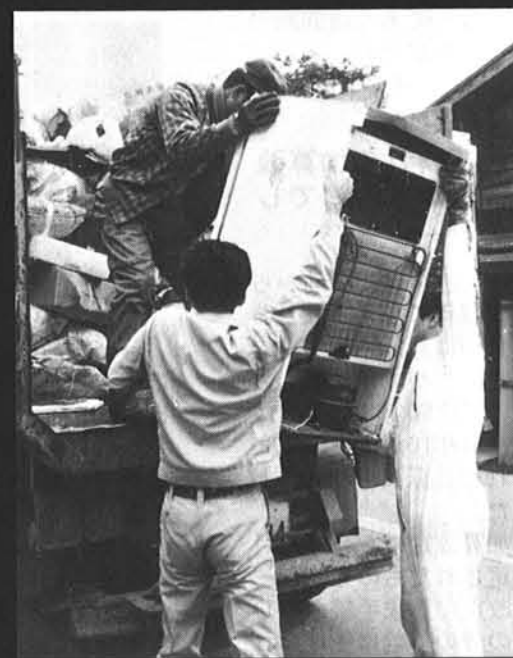
■三人がかりで、やっと積み上げられる大物も