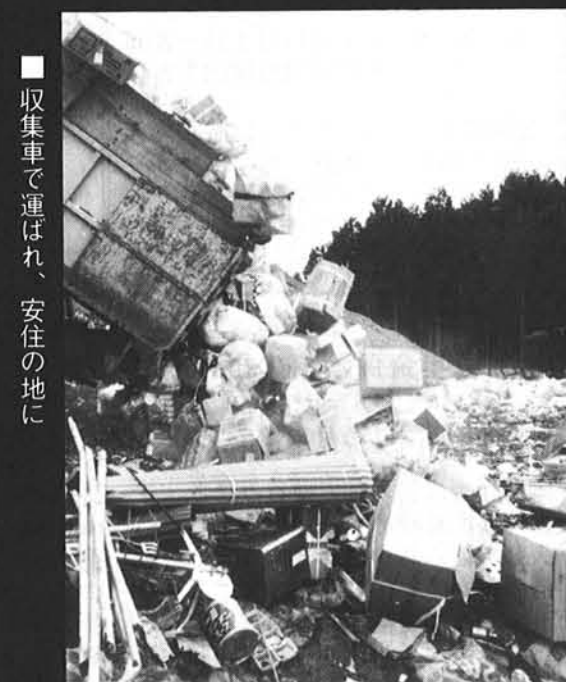
■収集車で運ばれ、安住の地に