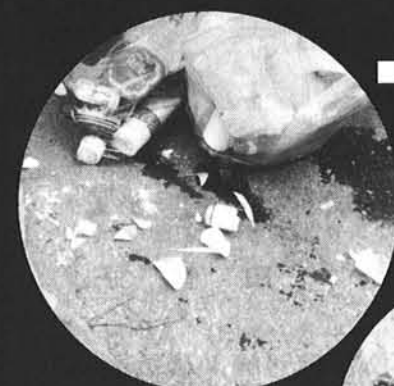
■あぶないんです、こういうのが