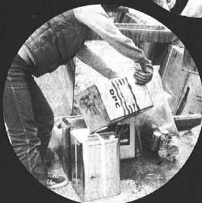
■中に水や油が入っている事も度々