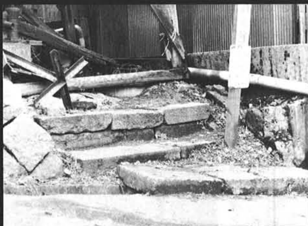
■こんなに山と積まれたゴミもきれいに片づけられて

町かどに捨てられるのは悲しい。 心まずしい人に使用されたのが恥ずかしい。 しかし、私たち老兵にも希望の光がさしてきました。 決まった日、決まった場所に約束を守って捨ててくれるようになってきました。 「クリーンよいた」を実践する主人たちの声も聞こえてくるようです。 私たち老兵は、このような主人に愛される事を心から望んでいます。