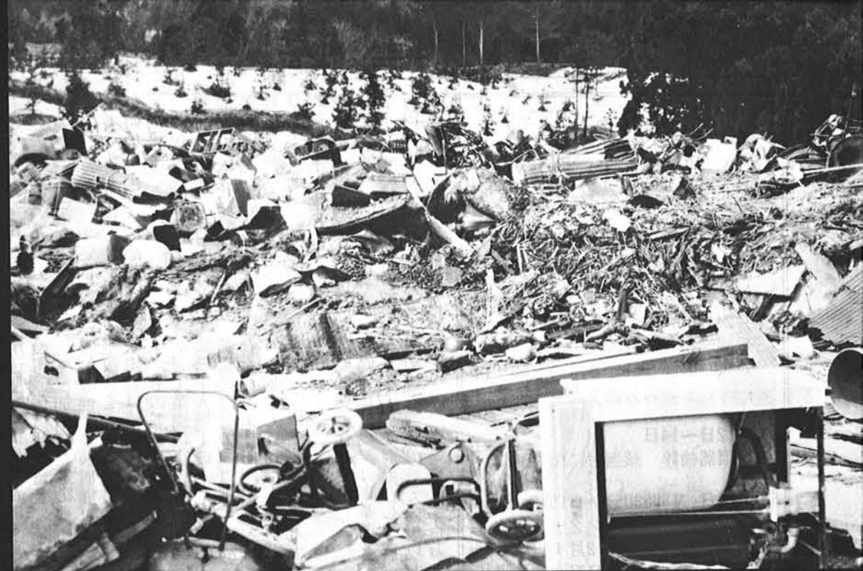
■埋め立て場所も、もうこんなに一杯

町かどに捨てられるのは悲しい。 心まずしい人に使用されたのが恥ずかしい。 しかし、私たち老兵にも希望の光がさしてきました。 決まった日、決まった場所に約束を守って捨ててくれるようになってきました。 「クリーンよいた」を実践する主人たちの声も聞こえてくるようです。 私たち老兵は、このような主人に愛される事を心から望んでいます。