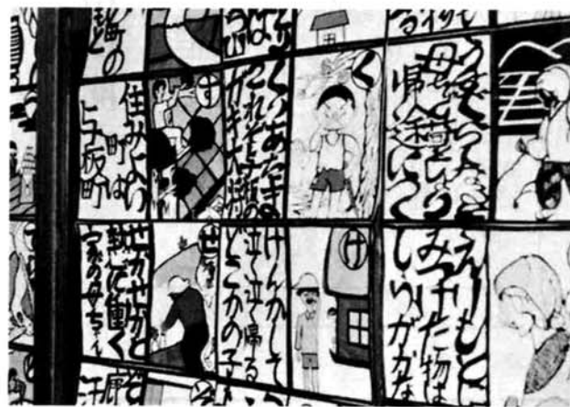
▲ 心に残る卒業生作品