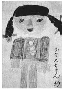
かなえちゃんの顔