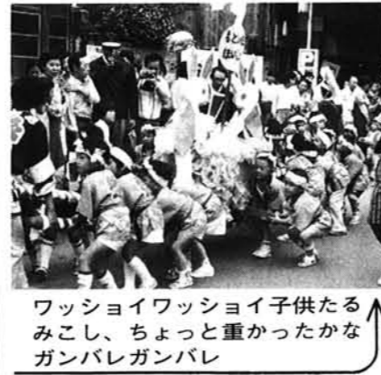
ワッショイワッショイ子供たる みこし、ちょっと重かったかな ガンバレガンバレ