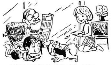
動物は家族の一員です。終生飼う心構えが大切です。

【5】 一、犬を飼うにあたっての心構え あなたの飼育目的、家庭環境にあった種類、大きさ、雌雄、性質などについて考え、更に家族全員の理解と協力が得られるかどうか検討し、一度飼ったら終生飼う心構えが必要ですよ。