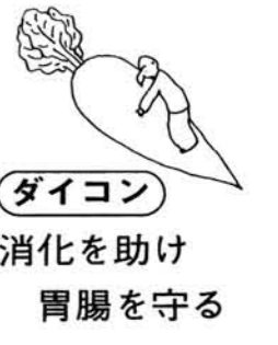
ダイコン 消化を助け 胃腸を守る

②の式に該当する建物は償却額と上昇分の差額を従前の評価額から控除して新評価額といたします。 なお、費用の上昇率と耐用年数は、その建物の構造や用途によってそれぞれ異なっております。 以上のような方法で、家屋の評価替を行っておりますが、新築家屋の評価後における内部の改装や一部分の改築などによる評価額の見直し、実務上困難です。直し、これらの不均衡をなくするには、近い将来全町一斉の家屋評価が必要になってきています。