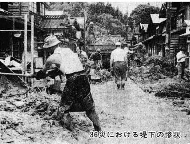
36災における堤下の惨状

「災害は忘れたころにやってくる」と申しますが、今冬の暖冬異変等、近年の異状天候にはなにかしら不安を感じざるをえません。 最近特に問題になってい、公害については私達は非常に敏感になつてきています。が、自然災害については忘れて忘れがちなのではないのでしょうか。 十年前の豪雨、台風、地震の恐しさはまだまだ忘れられることができません。 「大災害発生」それに伴う人類の危機、災害に対する無関心を憂慮する一部の者が、マスキをとおしてこいつた問題点をとらえて大衆に警告を与えていることも見逃せない事実です。 私達は過去の各種災害で果して被害を最少限に抑えたいと求めたのでしょうか。 また備えと心がまえは万全であつたのでしょうか。 もう一度再確認、再検討してみようではありませんか。 ※ 新潟県水防演習の開催について 新潟県の防災事業として町において河川氾濫を想定し、各種水防工法についての大がかりな水防訓練が次により実施されますのでお知らせいたします。