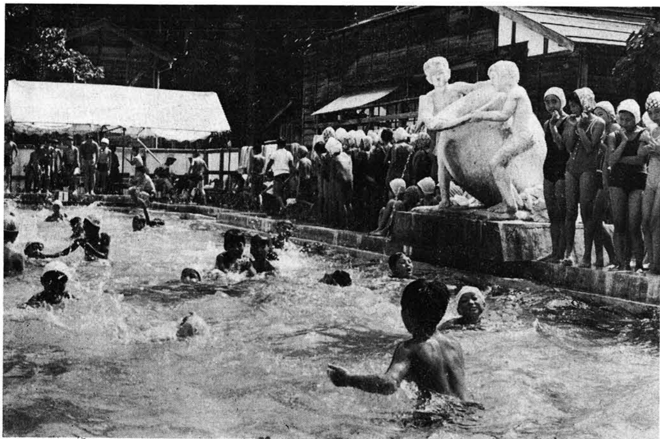
— 小学校プールにて —