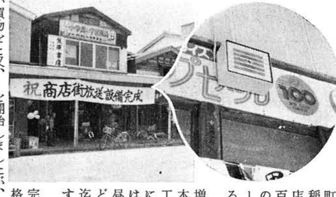
祝商店街放送設備完成

別院お取越の時、昔は、あの懐かしいサカスのシンタの音が響き渡るも、今はその面影もなく、今年「お化け屋敷」でも景気の良い音楽、呼び出しはきこえなかつたが、しかし、町中に流れる音楽に、随分と賑やかだナーと思われたことではある。