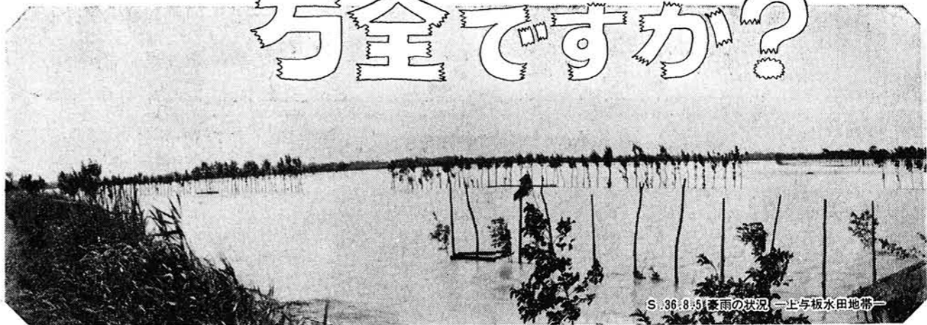
S. 36. 8. 6 豪雨の状況 上と板水田地帯