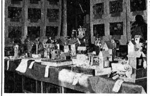
大会、音楽発表会、運動会と中学生らしく行なわれました。文化祭行事、参加団体の御協力ありがとうございました。

他の会場の公民館では謡曲の会、カルタ大会、詩吟の会、ハイキングクラブの山の写真と写真会、商工会の青年部は「コロニー建設資金募集の在町名士有志の色紙実費頒布会を明元寺で行ない他に、盆栽、菊花展、俳句の会とにぎわった。 町の別荘「楽山亭」では与板町石州会の茶会がおこそかに行なわれ秋空に和服が一段とさいっていました。 将棋は中越大会というこどで、町外からも参加者があり一日中白熱戦を戦っていました。 中学校では学校祭が二日から四日まで作品展、駅伝