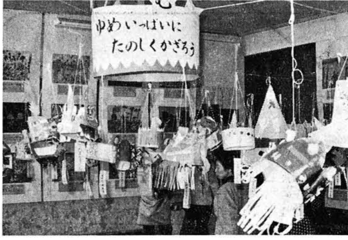
文化の日、町では文化祭の催し物が各会場で行なわれました。中でも小学校校会場は、一日は飾り付けでにぎわい、二日三日と展示された、小学生作品は各教室とも「ゆめと希望」に満ちてはちきれそうでした。ある一年生のお母さんは子供の作品を見つけて、おもしろニッコリ……。他に農業青年クラブの五周年記念農作物の品評会、高校生の作品、婦人会、保育所、保育園の作品、生花展、文化協会の美術展と校舎せましと開催され、連日子供づれの、おとうさんおかあさんにぎわいました。

他の会場の公民館では謡曲の会、カルタ大会、詩吟の会、ハイキングクラブの山の写真と写真会、商工会の青年部は「コロニー建設資金募集の在町名士有志の色紙実費頒布会を明元寺で行ない他に、盆栽、菊花展、俳句の会とにぎわった。 町の別荘「楽山亭」では与板町石州会の茶会がおこそかに行なわれ秋空に和服が一段とさいっていました。 将棋は中越大会というこどで、町外からも参加者があり一日中白熱戦を戦っていました。 中学校では学校祭が二日から四日まで作品展、駅伝