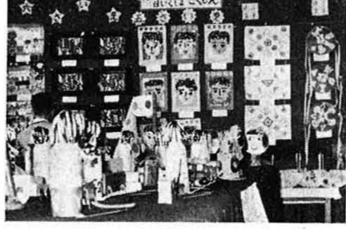
秋期火災予防運動

園児の作品大好評 保育園、保育所の園児の作品も小学校で展示されました。これらの作品も又、ゆめでいっぱい。小学生のおにいさん、おねいさんにまげず一生懸命に、作った作品もまた好評でした。