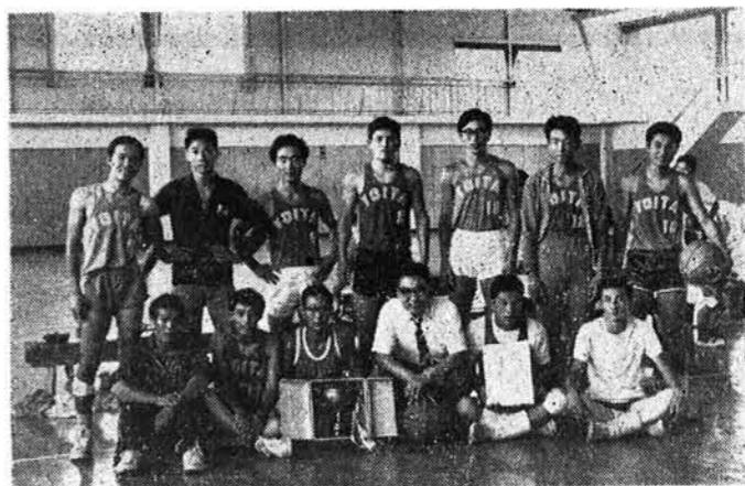
写真は優勝杯を手にした与板チーム