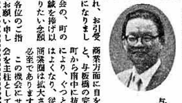
与板町商工界 一大飛躍の秋にあたって

お見舞いをいただき有難うございました お見舞いをいただき有難うございました。お見舞いをいただき有難うございました。お見舞いをいただき有難うございました。