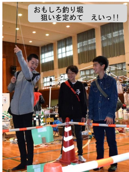
おもしろ釣り堀 狙いを定めて えいっ!!