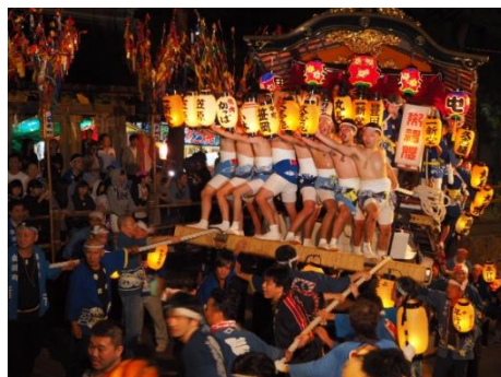
最優秀賞 「登り屋台」