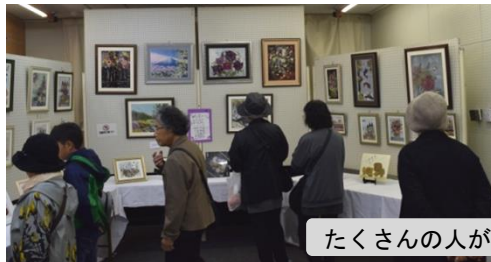
たくさんの人が作品展を鑑賞