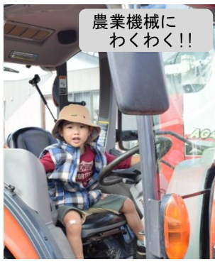
農業機械に わくわく!!