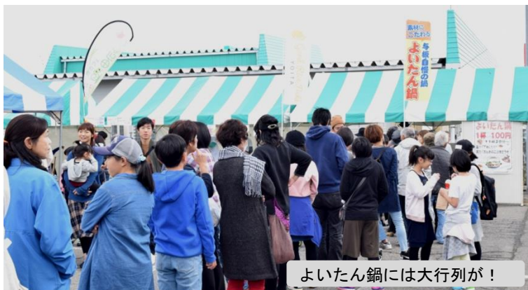
よいたん鍋には大行列が！