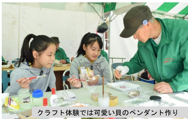
クラフト体験では可愛い貝のペンダント作り