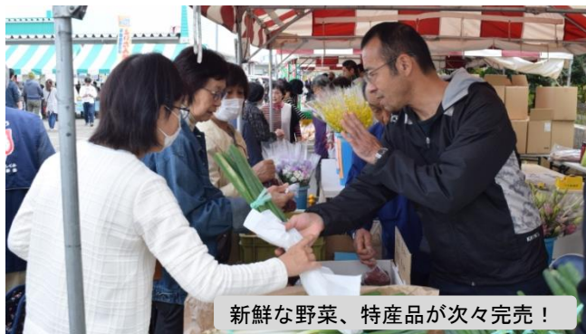
新鮮な野菜、特産品が次々完売！

その他、おもしろ釣り堀などの体験イベントにもたくさんの方が集まり、与板の秋を目で耳で舌で堪能しました。(10月27、28日)