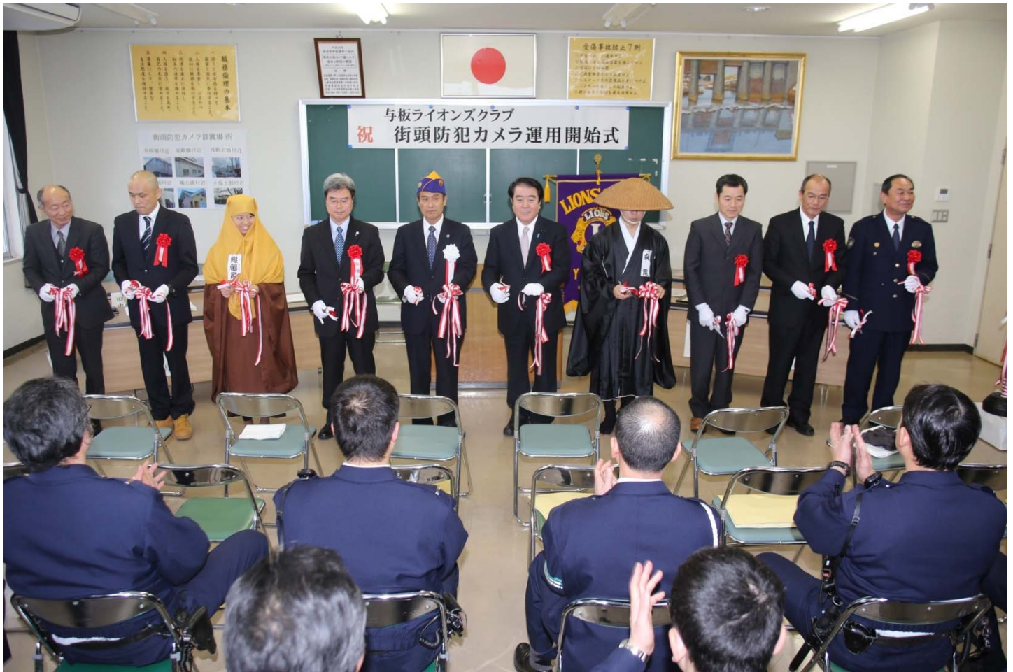
▲運用開始を祝い、テープカット