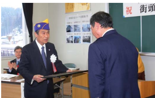
◀与板警察署長から感謝状がライオンズクラブに贈呈されました

ライオンズクラブが主体となって防犯カメラを設置・運用するのは県内でも例がなく、今回設置されたカメラは県の運用指針に基づき、適正に管理されます。(2月9日)