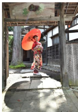
楽山苑フォトコンテスト 最優秀賞 「夢想う楽山亭の華」