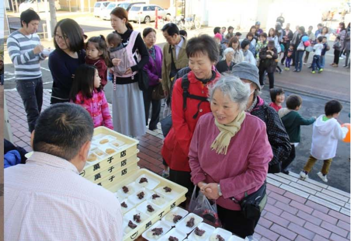
多彩な催しが楽しめた「与板いきいき文化フェスティバル」。芸能発表や地域内外からの出店で、大勢の人で賑わいました。(11月1日)