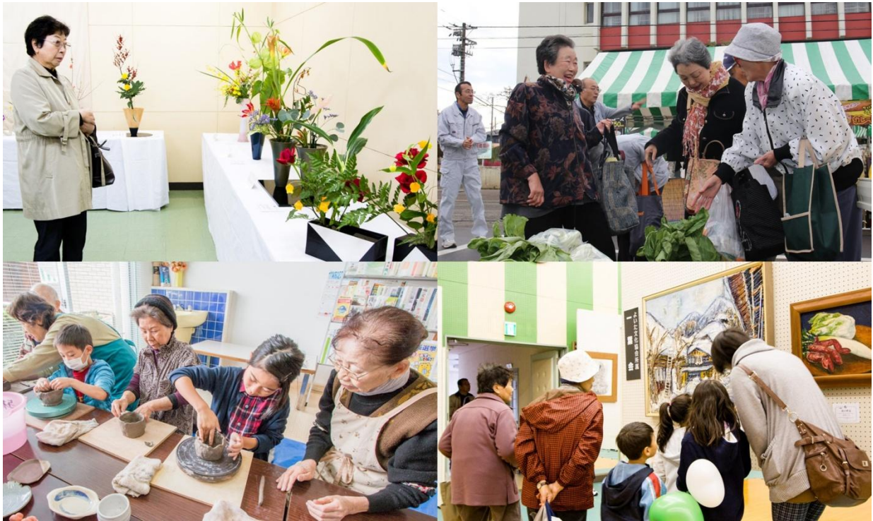
日ごろ生涯学習として活動している団体や個人の力作の展示や新鮮な地元産野菜の即売、陶芸体験など、多彩な催しを楽しむ来場者。(陶芸体験コーナーの作品は「志保の里荘」で焼かれ、12月中旬に引き渡されます。)

多くの人から与板の秋を満喫してもらおうと、二つの恒例行事を組み合わせた「与板いきいき文化フェスティバル」が開催されました。