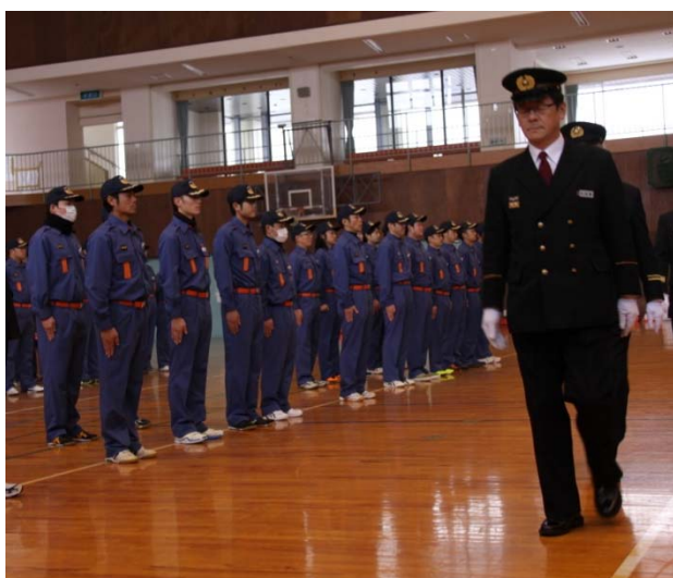
消防団員の整列、閲団の様子