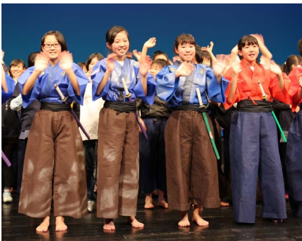
演技を終え、観衆の拍手に応える児童