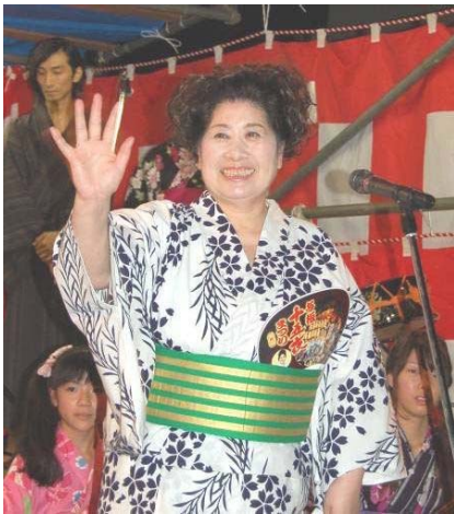
↑ 民謡流しに登場 この後、踊りの輪の中に入り、参加者とひとときを楽しみました