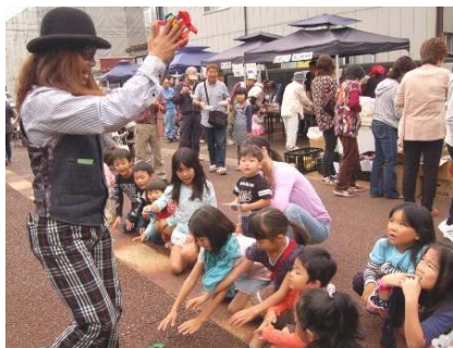
← 「与板衆」に扮した中学3年生

同日「秋の観光まつり」も、まちの駅よいた前で開催され、与板地域の特産品の販売や拓本体験、マジックショー、近隣地からの出店もあり、大勢の来場者で賑わっていました。