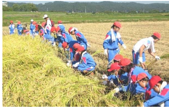
← 稲刈り鎌を使い、一株一株