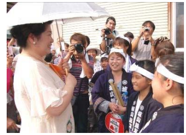
↑ 手紙を渡されて喜ぶあきさん「また与板に来てください」と書いたそうです