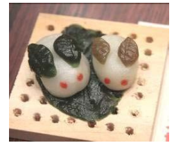
←ちんころ最優秀賞作品