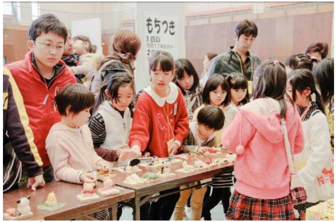
↑ 米粉を練って作る小さな人形「ちんころ」作りは子どもたちに大人気