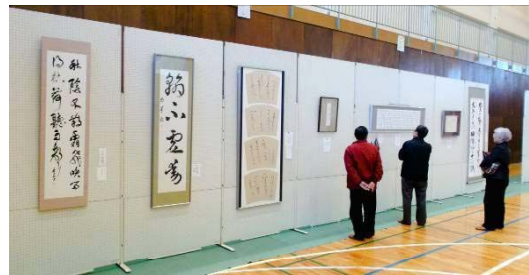
↑トランポピクス ←作品展