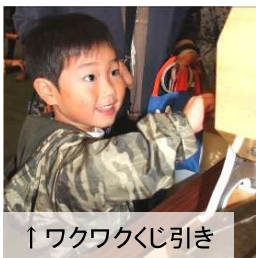
↑ワクワクくじ引き