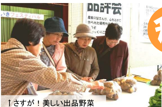
↑さすが！美しい出品野菜