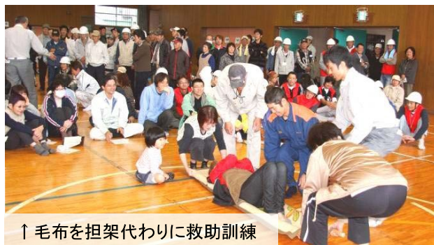
↑毛布を担架代わりに救助訓練

この日、長岡市消防団与板方面隊の消防演習も行われ、多数の地域住民が見守る中、日頃の訓練の成果を遺憾なく発揮しました。