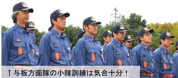
↑与板方面隊の小隊訓練は気合十分！

この日、長岡市消防団与板方面隊の消防演習も行われ、多数の地域住民が見守る中、日頃の訓練の成果を遺憾なく発揮しました。