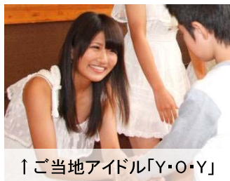
↑ご当地アイドル「Y・O・Y」