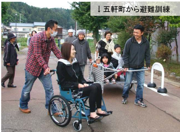
↓五軒町から避難訓練

大地震を想定した防災訓練に、7町内会の住民や消防団員等518人が参加し、初期消火訓練や救急救命訓練などを行いました。(10月23日)