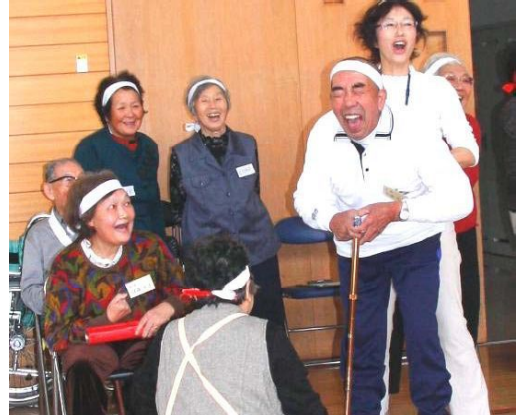
↑ ゲートボール「あ～惜しい！」