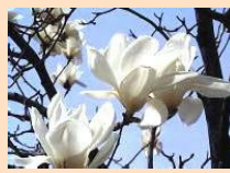
【自然な愛】 モクレン