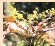
【激しい愛】 ナンテン