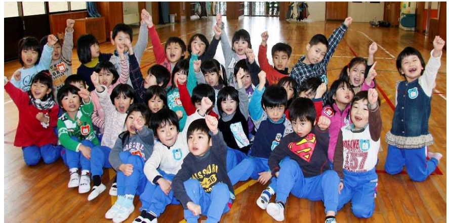
↑「元気な一年生になるぞ! お～!」(与板幼稚園年長児、3月2日)