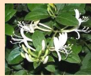
【愛の絆】 スイカズラ