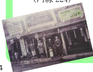
◀ 大正12年頃の中町薬局