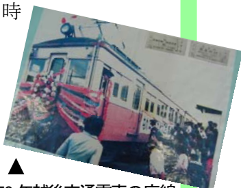
▲ 昭和50年越後交通電車の廃線