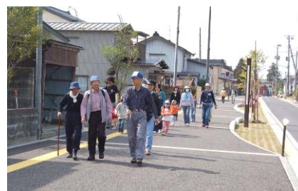
整備が進む自転車歩行者(優先)道路

その基となる与板地区都市再生整備計画(第5回変更)が、国土交通省から承認され、引き続き下記計画図の事業を推進します。