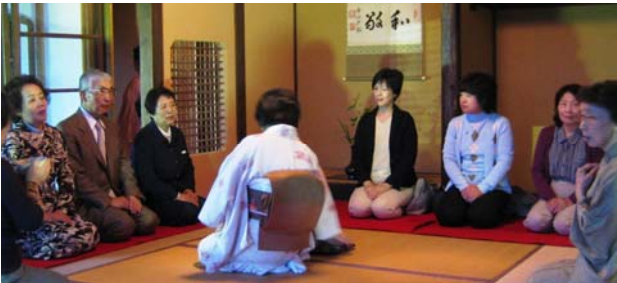
楽山亭ライトアップ事業(5月7日～16日)で行われるお茶会等、各種イベントのボランティアスタッフを募集中です。問合せは産業課まで