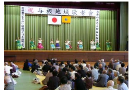
今年の与板地域敬老会は9月11日に開催します