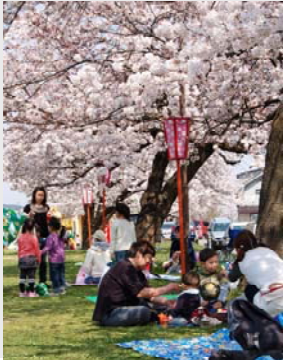
花見客で賑わう「たちばな公園」(昨年4月撮影)

春になりました。春といえば桜です。先行きが不透明な中で変わらないものがあると心が安らぐものですが、その一つに桜の歌があります。桜の満開の風情と散り際の潔さが日本人の心に共鳴し、平安の昔から桜は花の代名詞となり、多くの歌人が詠んできました。現代でも、春になると若い歌手がこぞって桜の歌を発表し、ヒット曲が生まれます。哀愁を帯びたメロディー、心象風景をとらえた詞が人々の心を打つのでしょう。さて、桜といえば花見。テレビでは、「花」を見ているのか「人」を見ているのかよく分からない桜の名所がテレビで放映されていますが、与板でも「たちばな公園」をはじめとした桜がまもなく見ごろとなります。皆様、大いに花見を楽しみましょう。(くれぐれもゴミはお持ち帰りください)