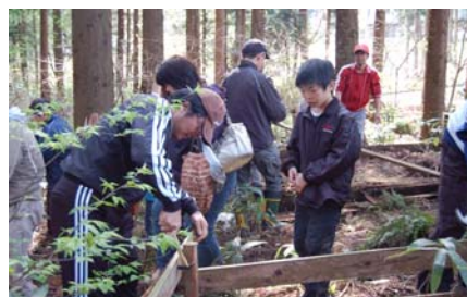
カブト虫自然産卵床作り