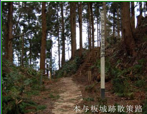
本与板城跡散策路