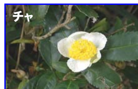
煎茶や抹茶等になる木