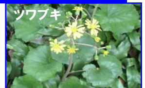
花名が兼続役の妻夫木さんの名前に似た花