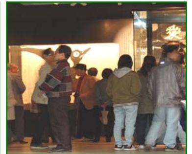
資料館の来場者は1月のオープンから約1万7千人(2月末現在)