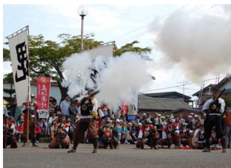
米沢藩鉄砲隊演武