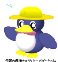
長岡の環境キャラクター ペギーちゃん