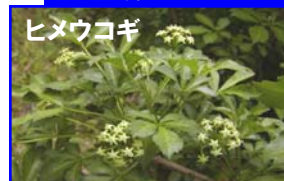
食用になるため、兼続が生垣に推奨