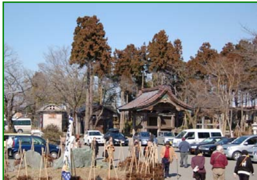
県外ナンバーも目立ちます