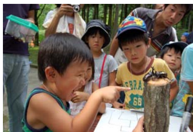
カブト虫の相撲大会