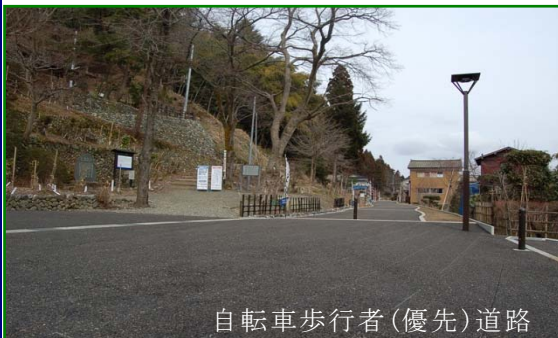
自転車歩行者(優先)道路