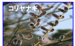
かつて与板特産だった柳行李の材料